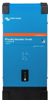
Střídač Phoenix Smart 12/2000