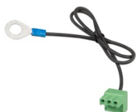
Konektor se smontovaným záporným DC kabelem (součástí balení)