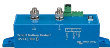
Ochrana baterie Smart BatteryProtect BP-100