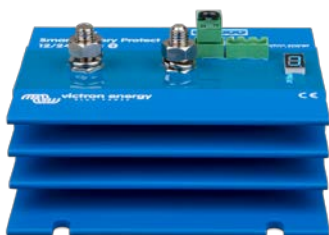
Ochrana baterie Smart BatteryProtect BP-220